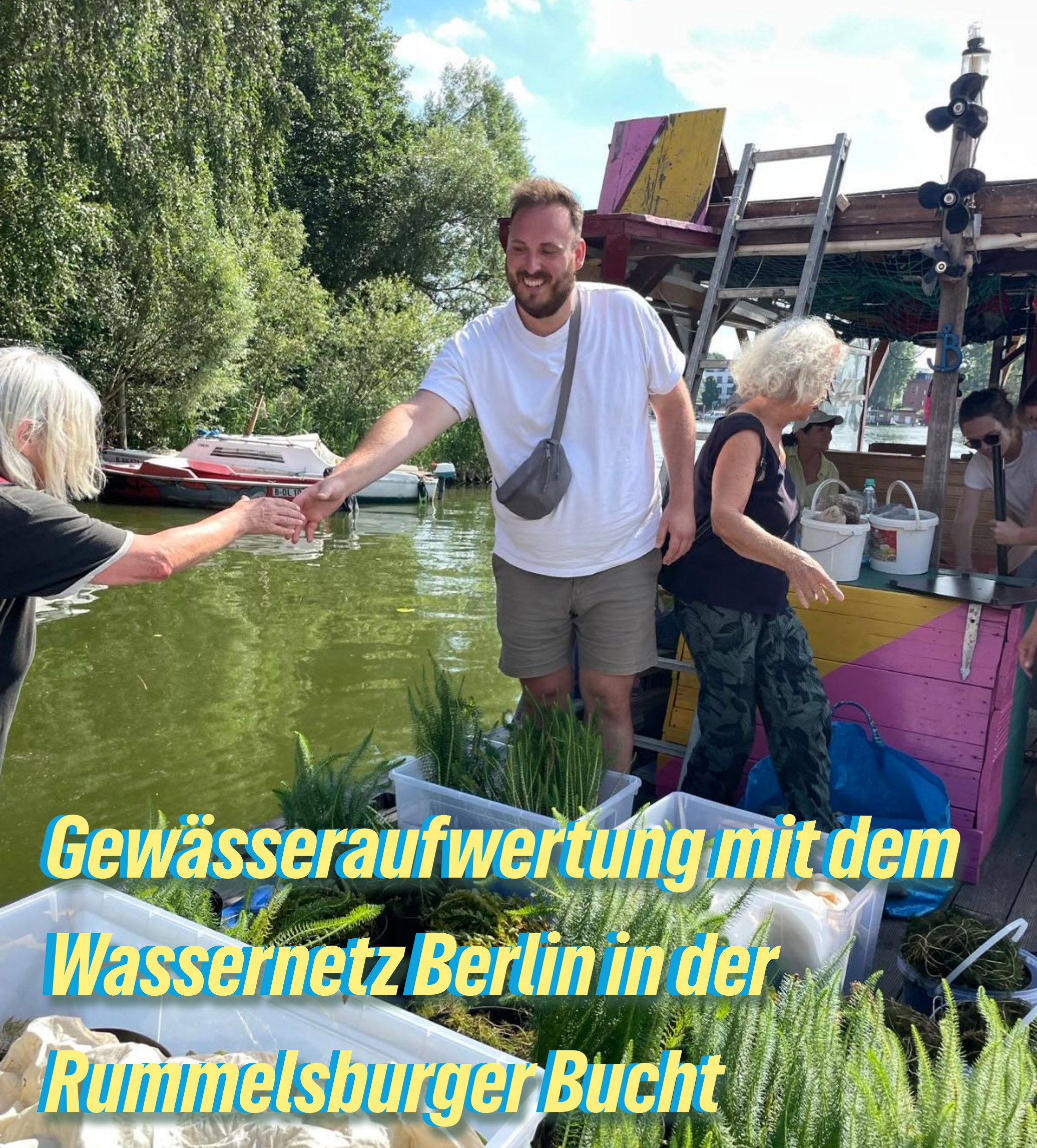
Gewässeraufwertung mit dem Wassernetz Berlin in der Rummelsburger Bucht