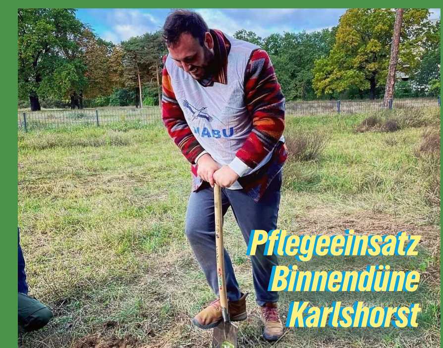
Pflegeeinsatz Binnendüne Karlshorst