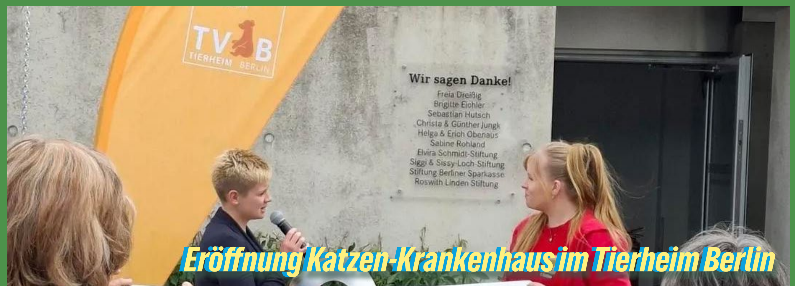
Eröffnung Katzen-Krankenhaus im Tierheim Berlin