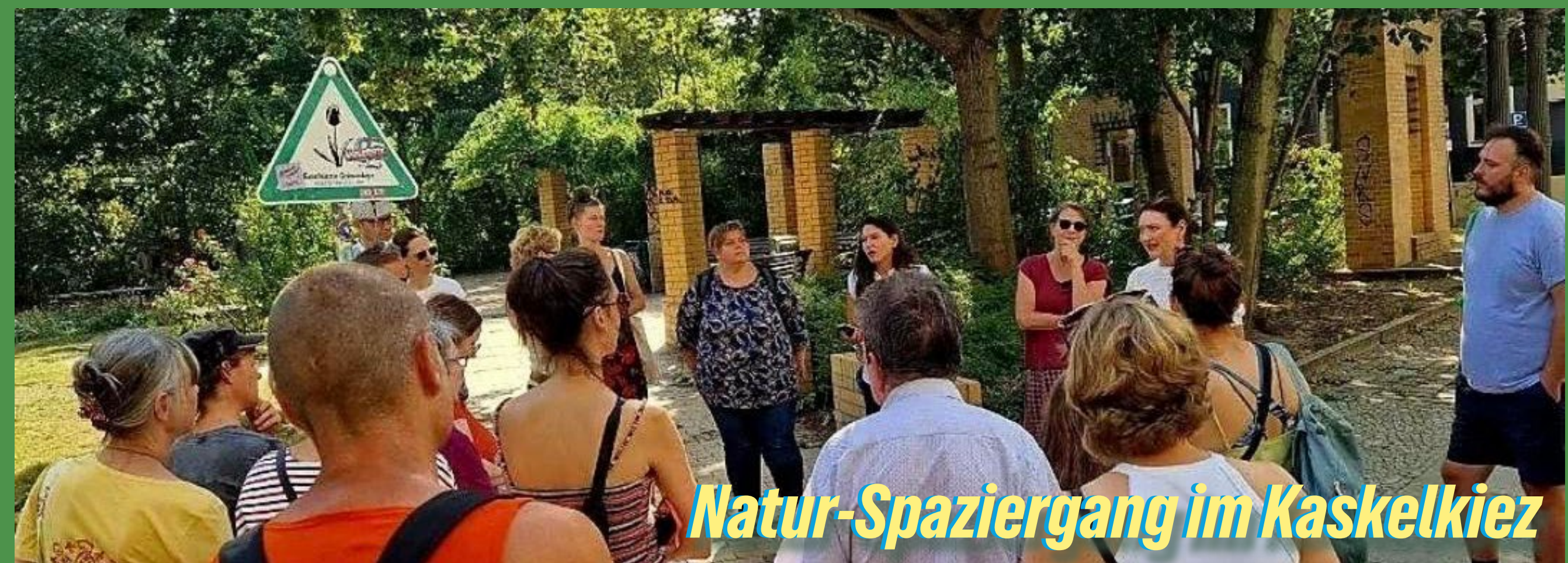
Natur-Spaziergang im Kaskelkiez