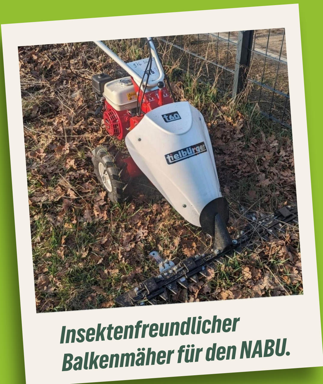
Insektenfreundlicher Balkenmäher für den NABU.