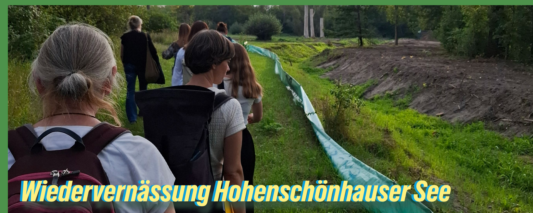
Wiedervernässung Hohenschönhauser See