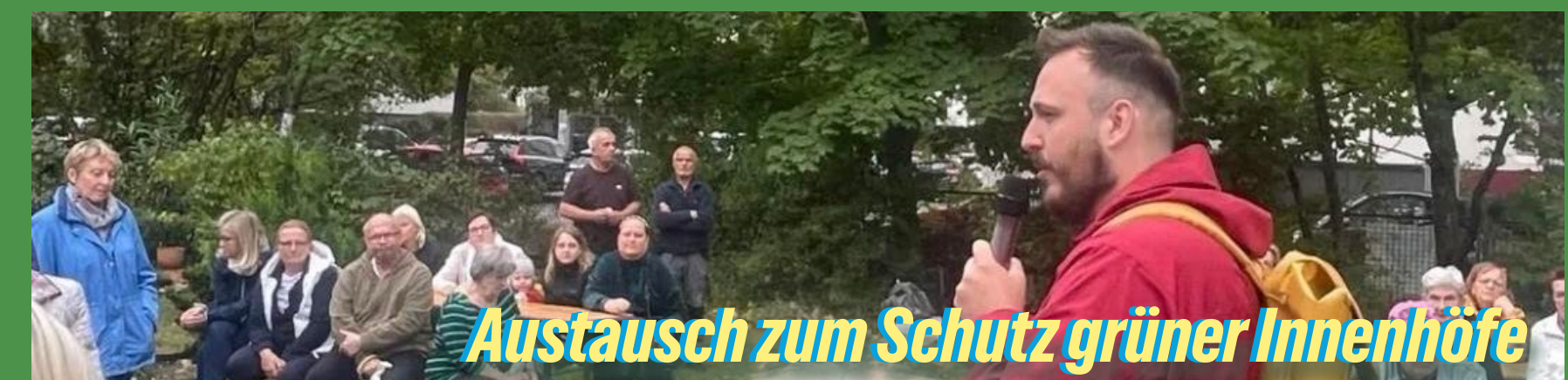
Austausch zum Schutz grüner Innenhöfe