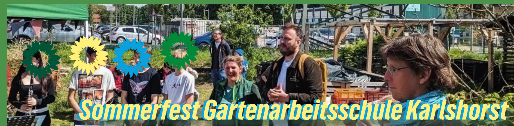
Sommerfest Gartenarbeitsschule Karlshorst