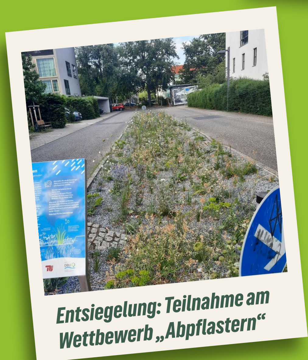
Entsiegelung: Teilnahme am Wettbewerb „Abpflastern“

verdrängt wird. Sie gehört mitten in die Stadt, in unsere Kieze.