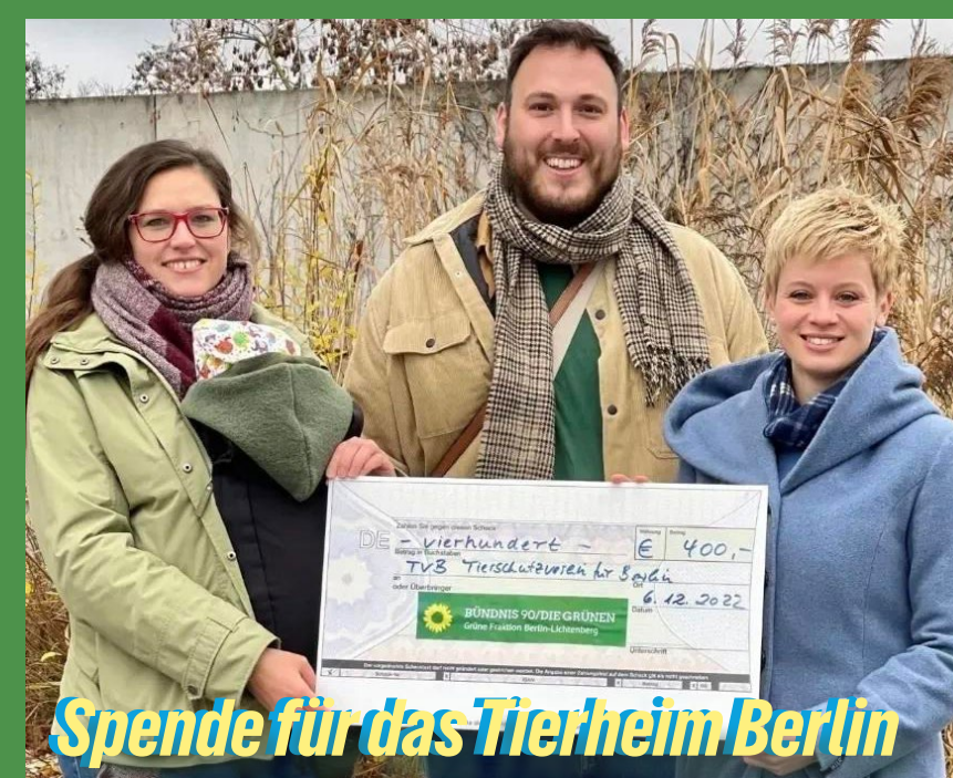
Spende für das Tierheim Berlin