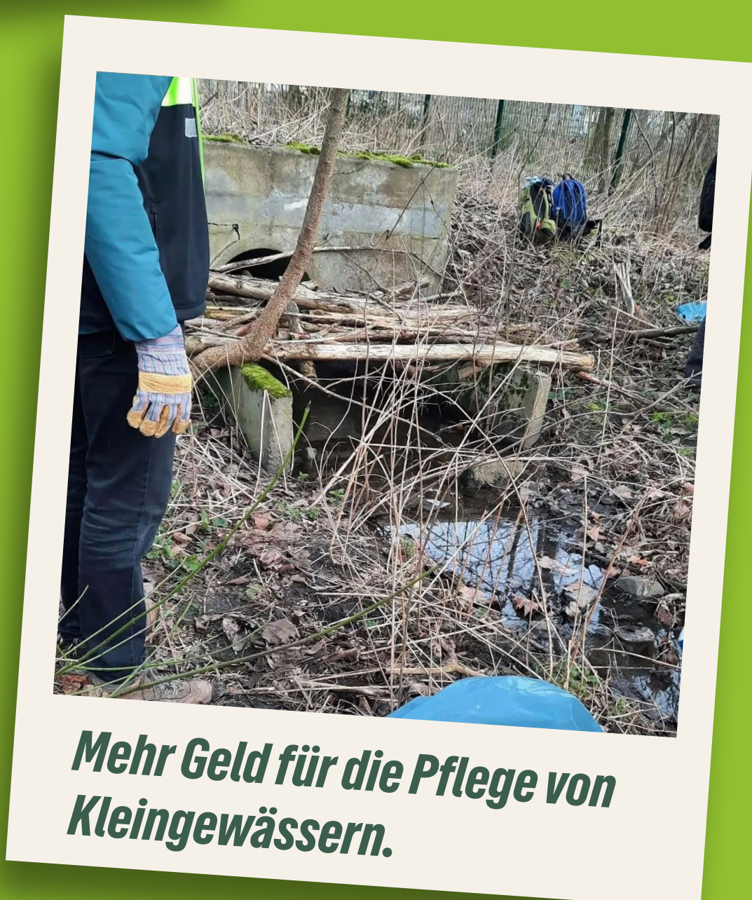
Mehr Geld für die Pflege von Kleingewässern.